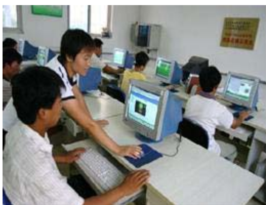
图.25 计算机培训中心

大兴位于中国北部，是首都北京南郊的一个县，是蔬菜和水果的农业基地。几年前，曾经有一则新闻报道说，大兴农民在家上网卖西瓜，三个月收入 400 万元。这则新闻报道实际上还告诉人们郊区百万农民开始学电脑的浪潮。上网，在城里已成为一种网络文化，而对农民来说，还是个新生事物，他们需要学习。县分中心参与满足这一大众文化需求，提供一个 40 台电脑的多媒体阅览室，将国家中心以及北京市分中心的网站链接到县图书馆的网站，老老小小的村民均可以上去各取所需。