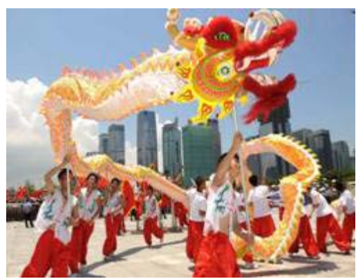
图 2 舞龙