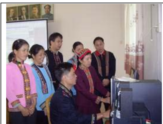
图 19 必背镇基层服务点

必背镇位于乳源县,是瑶族的发源地之一,全镇人口 7,314 之中,瑶族同胞有 5,914 人。瑶胞天生能歌善舞,他们用树叶演奏音乐,跳长鼓舞,跳竹竿舞。但是他们传统的娱乐受到外界的挑战,需要促进。2002 年,镇里成立了一支文艺表演队,在当地民间节日时到各个村巡回演出。队员们经常来镇服务点,上网查询瑶族文化资源以及最新节目,通过电脑或投影仪观赏,改良他们的节目表演。这支表演队出了好些优秀节目,2008 年在县里获奖,还去澳门演出。