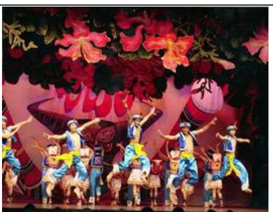
图 20 必背文艺表演队在澳门演出