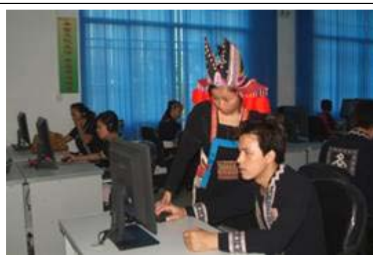
图 18 乳源县支中心电子阅览室

必背镇位于乳源县,是瑶族的发源地之一,全镇人口 7,314 之中,瑶族同胞有 5,914 人。瑶胞天生能歌善舞,他们用树叶演奏音乐,跳长鼓舞,跳竹竿舞。但是他们传统的娱乐受到外界的挑战,需要促进。2002 年,镇里成立了一支文艺表演队,在当地民间节日时到各个村巡回演出。队员们经常来镇服务点,上网查询瑶族文化资源以及最新节目,通过电脑或投影仪观赏,改良他们的节目表演。这支表演队出了好些优秀节目,2008 年在县里获奖,还去澳门演出。