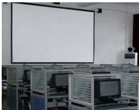
图 9 电子阅览室设备

共享工程投入大量的全新电子设备。例如广东省分中心的设备配置标准要求县分中心配备共享工程服务器、自动化管理服务器及数字化服务器各一台，3.6TB 以上的存储空间，一台主干交换机，两台百兆交换机，一台防火墙，10M 以上的宽带，一间主机房，一间 20 台电脑的阅览室，一台卫星接收仪，一台投影仪等。对村级的服务点，它要求配备一台电脑，一台电视机，一台 DVD 播放器，一台投影仪，一套音箱以及互联网的连接等。