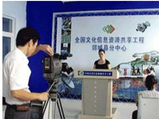
图 22 县支中心自行制作培训课件

于村是郟城县的一个银杏村，全村 1009 人，2008 年 900 万元的总收入中，银杏收入占 400 万。虽然有些村民已有电脑，能够在家上网谈生意，村民还是希望从村服务点那里得到更多的帮助。村服务点有 20 台电脑，一台 52 吋大屏数字电视，一台投影仪，一台 DVD 播放器，一台卫星接收器，可上网，有两名工作人员。例如，有一次，银杏树因过度施肥而枯黄，村服务点请来专家给村民做讲座如何合理施肥，这个讲座经过数字化后上网供更多的村民分享。据估计，这个讲座帮助村民节省肥料成本 20 万元，提高产量 100 万元。