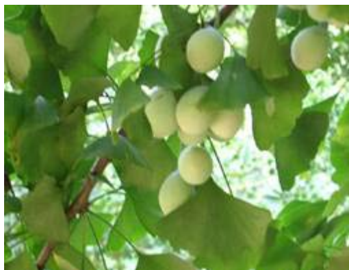
图 21 银杏

作，人类文明的起源，已发展成为一种文化，与全球市场以及新技术相结合。农民需要新的种植知识和商业技能。县分中心参与满足这一大众文化需求，提供 20 台电脑的多媒体阅览室，以及一个数字文化网站( www.tcwhj.com )，有丰富的农业知识、专家讲座以及市场信息引导。