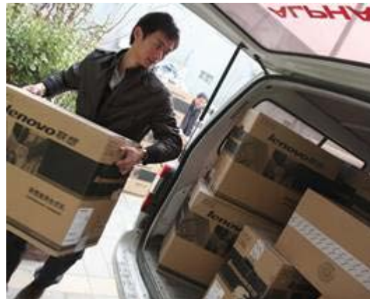
图 10 乡镇基层服务点的设备