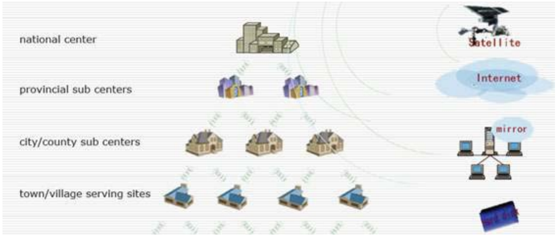
图 7-8 全国文化信息资源共享工程服务网络拓扑图

共享工程通过各级公共图书馆及乡村文化站承办的庞大的服务体系深入农村。由设立在国家图书馆的国家中心牵头，共享工程已设立 33 个省级分中心，截止 2008 年底，已有村级服务点 40 多万个，覆盖全国农村的 65%。例如，由广东省立中山图书馆承办的广东省分中心，截止 2008 年底已建立 21 个城市分中心，300 个县镇分中心以及 20,600 个村级服务点，覆盖全省的全部行政村。