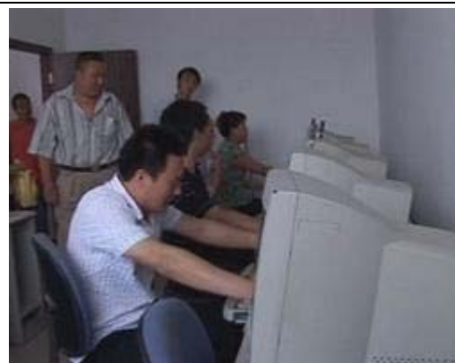
图.28 村基层服务点的电脑