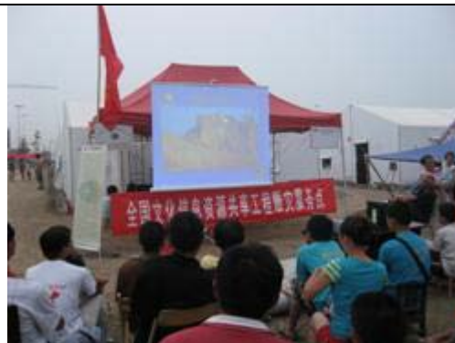
图.30 为震后临时安置点居民播放电影