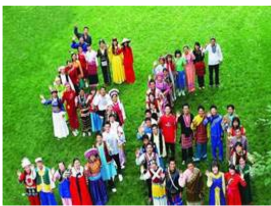
图 1 56 个民族

在中国，13 亿人口还有一半以上仍然住在广阔的农村。我们有 56 个民族，他们说不同的语言（方言），他们有不同的宗教习俗，不同的民间节庆，不同的服饰饮食，不同的历史自然景观，他们以不同的方式表达生活，包括音乐、舞蹈、戏剧等。而且，农民需要各自的传统文化以及农耕文化的同时，也需要新兴文化，他们对影视的喜爱胜于阅读。总而言之，他们有多种的大众文化需求。