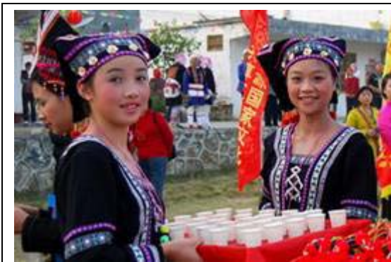
图 17 乳源县旅游文化节