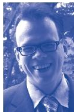
西尼卡·西皮莱 (Sinikka Sipilä) 2012年世界图书馆与信息大会国家委员会联合主席