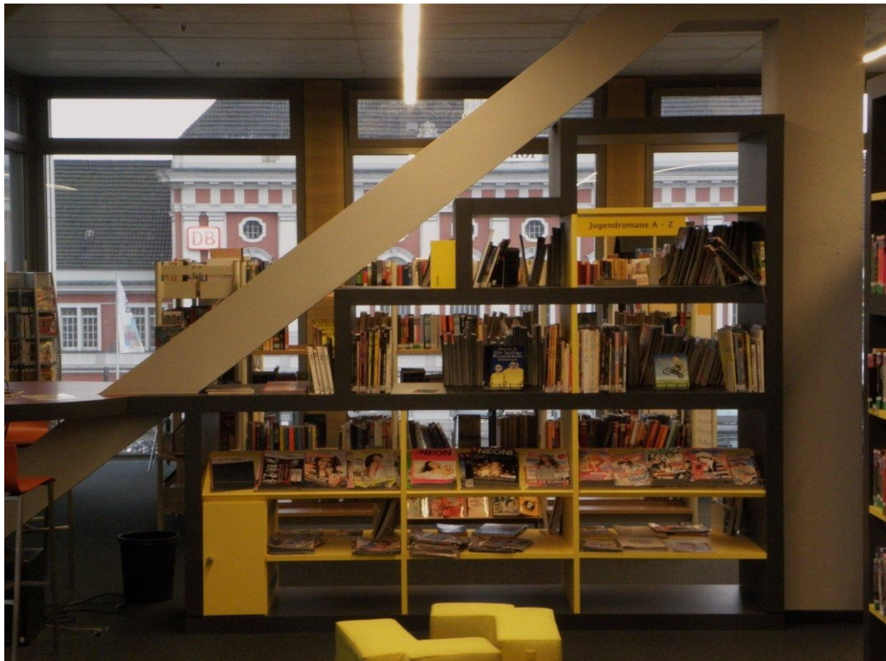
Estantería para jóvenes.

alberga una impresionante colección de materiales de aprendizaje de idiomas, diccionarios y ediciones didácticas, completada con libros sobre geografía aplicada y viajes. El aprendizaje de idiomas y los servicios a la población multicultural de Hamm se acompaña de la educación intercultural. Algunas áreas de esta planta, como la sección de audio libros 'HörBar' y los estantes para libros de arte de gran formato están equipados con muebles especiales que determinan el aspecto especial de esta planta.