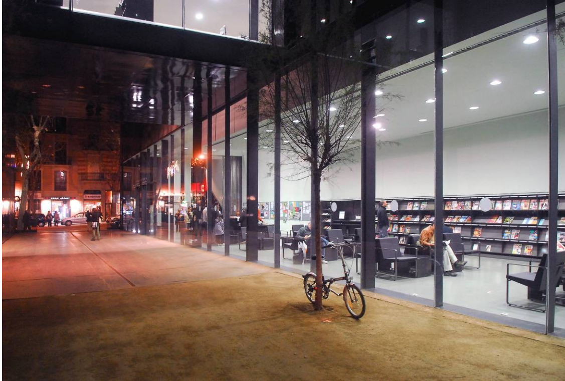
Imagen 2. Biblioteca Sant Antoni - Joan Oliver.

En cuanto a la movilidad, la definición del mapa de las bibliotecas públicas ya tuvo en cuenta el impacto que las bibliotecas podían tener sobre la movilidad de los ciudadanos. Se planificaba pensando en desplazamientos a pie desde el propio hogar hasta la biblioteca, en recorridos que no excedieran los 15-20 minutos, una media que parece haberse constituido como recomendable. Si bien en aquel primer mapa no se cubría todo el territorio, sí que la distancia entre equipamientos tenía en cuenta esta característica.