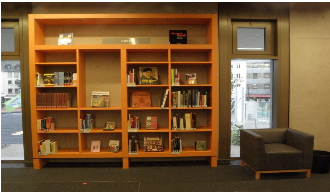
Estantería y butaca.

arquitectónicamente ambiciosa terminal de autobuses y por el Heinrich von Kleist Forum. Hay otras dos instituciones que comparten el complejo, el centro de educación de adultos y un colegio privado de logística y economía de la energía. Un espacioso hall de entrada con una cafetería, un auditorio y la oficina de información del centro de educación de adultos hace visible el carácter multifuncional del edificio. La entrada principal de la biblioteca se encuentra también en esta área. Se trata de un atrio con un techo de cristal. El visitante percibe los cuatro pisos de la biblioteca a primera vista.