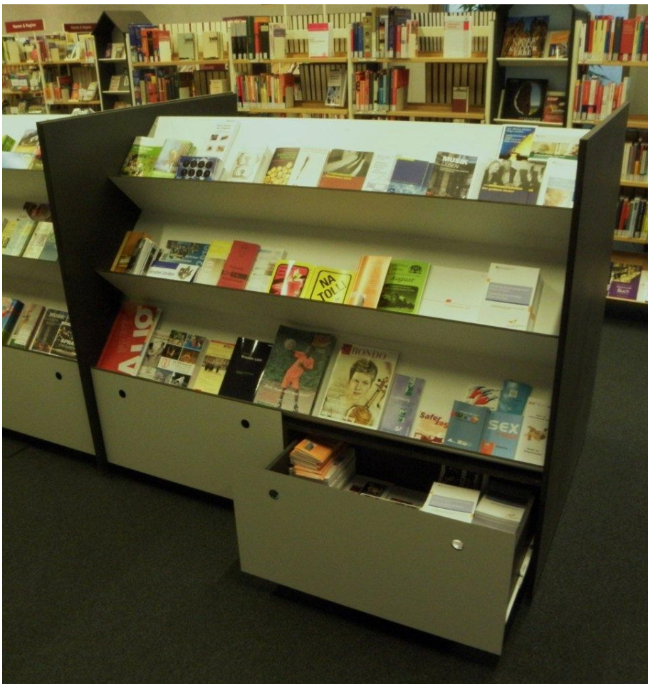
Estantería de audiovisuales.

infantil se ha diseñado como un paisaje con áreas confortables y animadas. El coherente con una discreta combinación de colores hacen de la biblioteca central un exitoso lugar de información, de comunicación y de encuentro para la comunidad de Hamm. La automatización de los servicios y la logística se consigue sin dejar solos a los usuarios. Un sistema de devolución, ordenación y manejo de fondos, el primero de su clase en una biblioteca pública alemana por cierto, resuelve los problemas logísticos de una biblioteca de cuatro plantas. En general, el Heinrich-von-Kleist Forum no es sólo un centro para la comunidad, sino una nueva puerta de entrada a la ciudad.