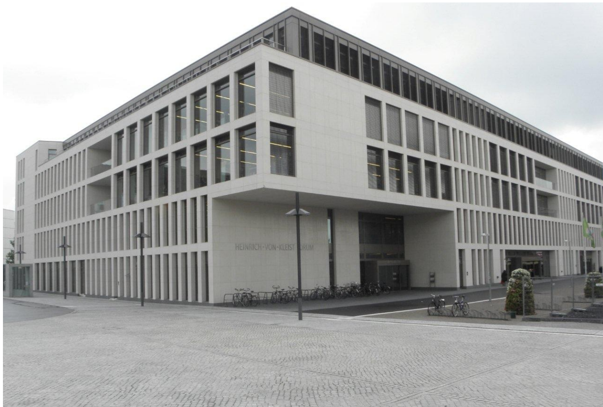
Heinrich-von-Kleist-Forum.