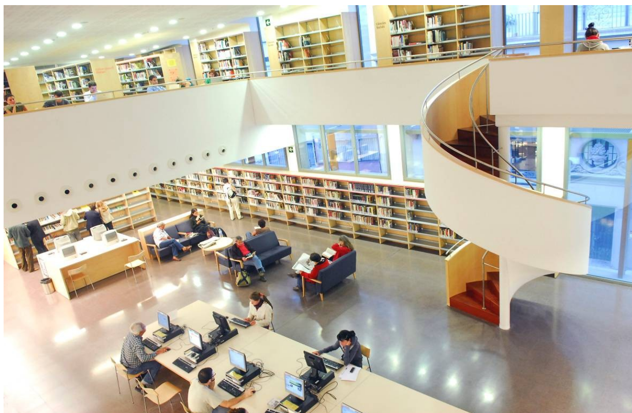
Imagen 1. Biblioteca Jaume Fuster.

edificios, y otros tres se han ampliado o renovado totalmente, favoreciendo la mejora de la calidad de los servicios ofrecidos. El caso seguramente más espectacular es el de una biblioteca en el distrito de Gràcia, de 208 m 2 de superficie, que en 2005 se transformó en la biblioteca Jaume Fuster , de 5.636 m 2 , la biblioteca pública más grande de la ciudad.