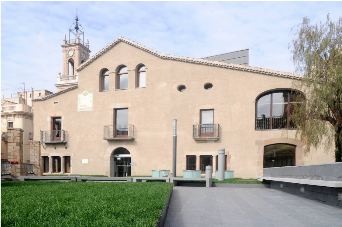
Imagen 3. Biblioteca Horta - Can Mariner.

También se ha recuperado una masía, la de Can Mariner en Horta (la biblioteca Horta-Can Mariner ), una manera de recordar el pasado agrícola de algunos espacios que han quedado absorbidos por la ciudad.